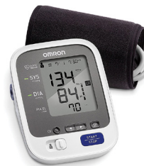
OMRON 7 Series