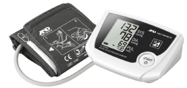
A&D A&D Medical