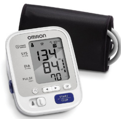
OMRON 3 Series